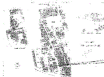
شارع الرامي المعد له خط التنظيم

المادة ١٠١ من قانون تنظيم المدن والقرى والمناطق الحضرية رقم ١٠١ لسنة ٢٠٢٦ مقتضى المادة ١٠١ من قانون تنظيم المدن والقرى والمناطق الحضرية رقم ١٠١ لسنة ٢٠٢٦ بمقتضى المادة ١٠١ من قانون تنظيم المدن والقرى والمناطق الحضرية رقم ١٠١ لسنة ٢٠٢٦ بمقتضى المادة ١٠١ من قانون تنظيم المدن والقرى والمناطق الحضرية رقم ١٠١ لسنة ٢٠٢٦