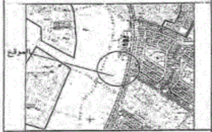
تقسيم المساحة الأرضية