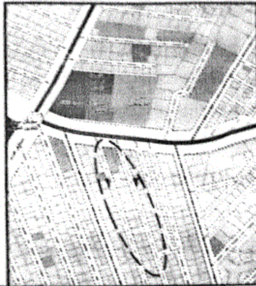
المخطط التفصيلى - لحي غرب المنصورة - لوحة رقم (٢)

(٢-١) يتم تعديل عرض الشارعين المحددين برقمى (١-٢) من عرض (٨م) إلى (٦م) ، ليتوافق مع ما هو قائم على الطبيعة حفاظاً على الملكيات الخاصة ، مع الالتزام بتطبيق الاشتراطات البنائية والتخطيطية الواردة بالمخطط التفصيلى المعتمد للمدينة وأحكام القانون رقم ١١٩ لسنة ٢٠٠٨ ولائحته التنفيذية وتعديلاتها ، وذلك بما لا يتعارض مع المخطط الاستراتيجى المعتمد للمدينة كما هو موضح بالرسم .