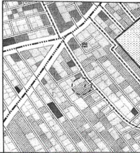
المخطط التفصيلي لمدينة تسمى الأمديد المنطقة رقم (٤)

(١٤-٤) يتم إدراج الشارع المحدد برقم (١) بعرض (٦م) ليتوافق مع ما هو قائم على الطبيعة حفاظاً على الملكيات الخاصة ، مع الالتزام بتطبيق الاشتراطات البنائية والتخطيطية الواردة بالمخطط التفصيلي المعتمد للمدينة وأحكام القانون رقم ١١٩ لسنة ٢٠٠٨ ولائحته التنفيذية وتعديلاتها ، وذلك بما لا يتعارض مع المخطط الاستراتيجي المعتمد للمدينة كما هو موضح بالرسم .