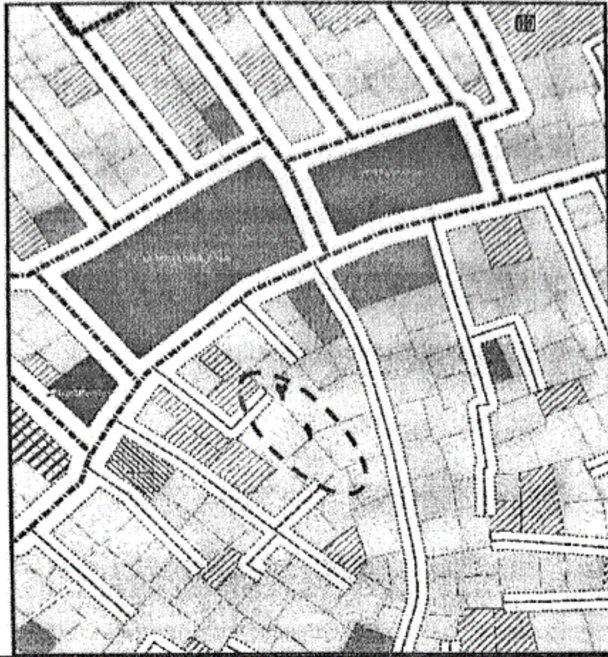
المخطط التفصيلي لمدينة نسي الأمديد المنطقة رقم (٢)

(١-٢) يتم إلغاء جزء من الشارع المحدد برقم (١) بعرض (٦م) وإلغاء الشارع المحدد برقم (٢) بعرض (٦م) ليتوافق مع ما هو قائم على الطبيعة حفاظاً على الملكيات الخاصة ، مع الالتزام بتطبيق الاشتراطات البنائية والتخطيطية الواردة بالمخطط التفصيلي المعتمد للمدينة وأحكام القانون رقم ١١٩ لسنة ٢٠٠٨ ولائحته التنفيذية وتعديلاتها ، وذلك بما لا يتعارض مع المخطط الاستراتيجي المعتمد للمدينة كما هو موضح بالرسم .