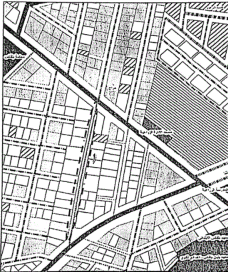
المخطط التفصيلي لمدينة بلقاس - منطقة رقم (٦)

يتم تعديل عرض شارع رقم (١) من (٦م) إلى (٨م) ، ليتوافق مع ما هو قائم على الطبيعة حفاظاً على الملكيات الخاصة ، مع الالتزام بتطبيق الاشتراطات البنائية والتخطيطية الواردة بالمخطط التفصيلي المعتمد للمدينة وأحكام القانون رقم ١١٩ لسنة ٢٠٠٨ ولائحته التنفيذية وتعديلاتها ، وذلك بما لا يتعارض مع المخطط الاستراتيجي المعتمد للمدينة كما هو موضح بالرسم .