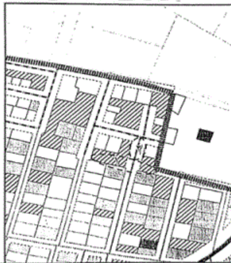
المخطط التفصيلي لمدينة بلقاس - المنطقة رقم (١)

يتم إلغاء الشارع المحدد برقم (١) بعرض (٦م) وإدراج الشارع المحدد برقم (٢) بعرض (١٠م) ، ليتوافق مع ما هو قائم على الطبيعة حفاظاً على الملكيات الخاصة ، مع الالتزام بتطبيق الاشتراطات البنائية والتخطيطية الواردة بالمخطط التفصيلي المعتمد للمدينة وأحكام القانون رقم ١١٩ لسنة ٢٠٠٨ ولائحته التنفيذية وتعديلاتها ، وذلك بما لا يتعارض مع المخطط الاستراتيجي المعتمد للمدينة كما هو موضح بالرسم .