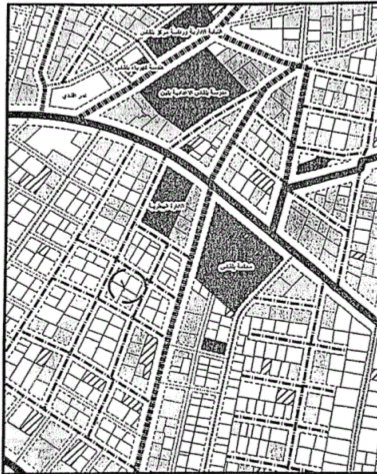
المخطط التفصيلي لمدينة بلقاس-منطقة رقم (٦)

يتم إلغاء الشارع المحدد برقم (١) بعرض (٦م)، ليتوافق مع ما هو قائم على الطبيعة حفاظاً على الملكيات الخاصة ، مع الالتزام بتطبيق الاشتراطات البنائية والتخطيطية الواردة بالمخطط التفصيلي المعتمد للمدينة وأحكام القانون رقم ١١٩ لسنة ٢٠٠٨ ولائحته التنفيذية وتعديلاتها ، وذلك بما لا يتعارض مع المخطط الاستراتيجي المعتمد للمدينة كما هو موضح بالرسم .