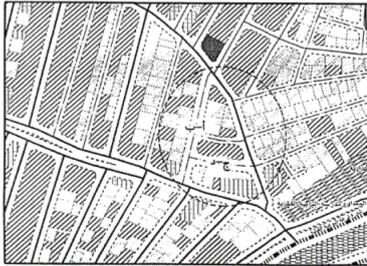
المخطط التفصيلي لمدينة المنبلاوين منطقة رقم (١٠)

١ - ١ يتم تعديل عرض الشارعين المحددين (أ ، ب) و(ج ، د) من عرض (١٠) أمتار إلى (٦) أمتار ليتوافق مع ما هو قائم على الطبيعة حفاظاً على الملكيات الخاصة ، مع الالتزام بتطبيق الاشتراطات البنائية والتخطيطية الواردة بالمخطط التفصيلي المعتمد للمدينة وأحكام القانون رقم ١١٩ لسنة ٢٠٠٨ ولائحته التنفيذية وتعديلاتها ، وذلك بما لا يتعارض مع المخطط الاستراتيجي المعتمد للمدينة كما هو موضح بالرسم .