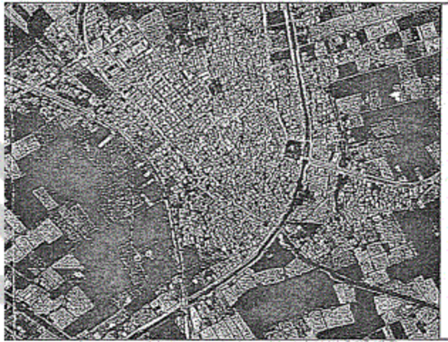
الصورة الفضائية لقرية قيريط

محافظة كفر الشيخ الادارة العامة للتخطيط والتنمية العمرانية