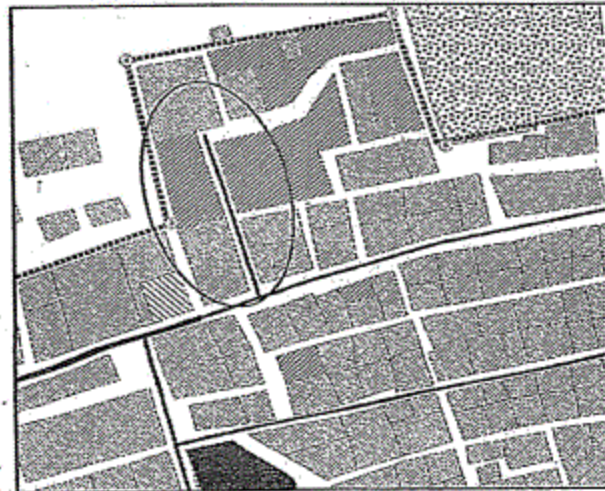
الموقع بعد التعديل