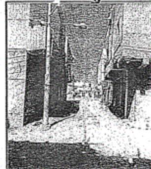
الموقع على الطبيعة