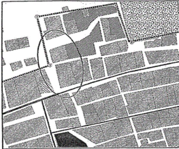
الموقع قبل التعديل