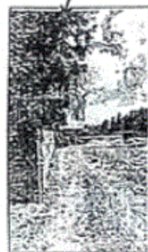
الموقع على الطبيعة