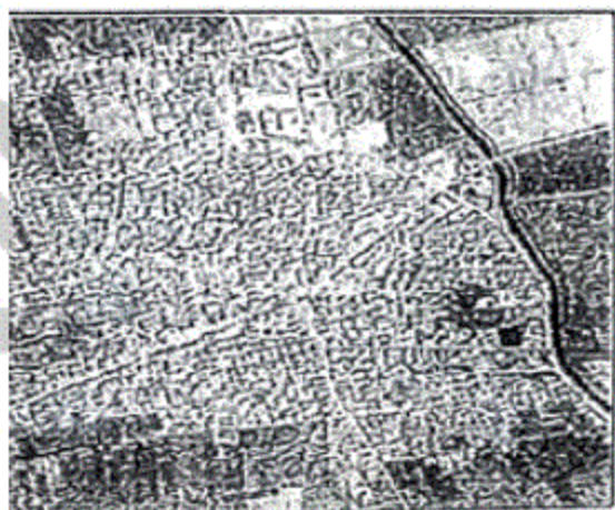
الصورة الفضائية لقرية ميت الديبة

محافظة كفر الشيخ الإدارة العامة للتخطيط والتنمية العمرانية