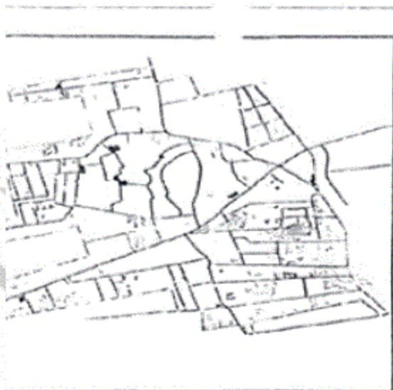
المخطط التفصيلى لقرية ميت الديبة