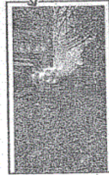
الموقع على الطبيعة