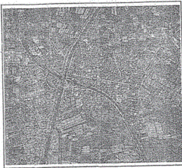
الصورة الفضائية لمدينة الحامول