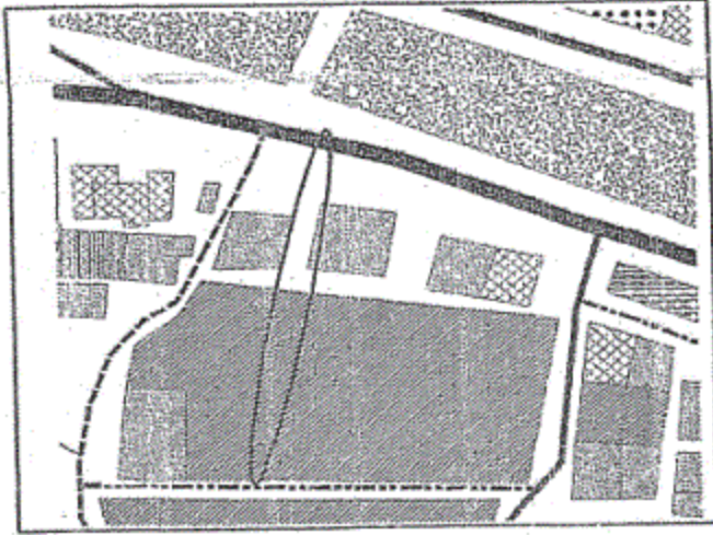
الموقع قبل التعديل