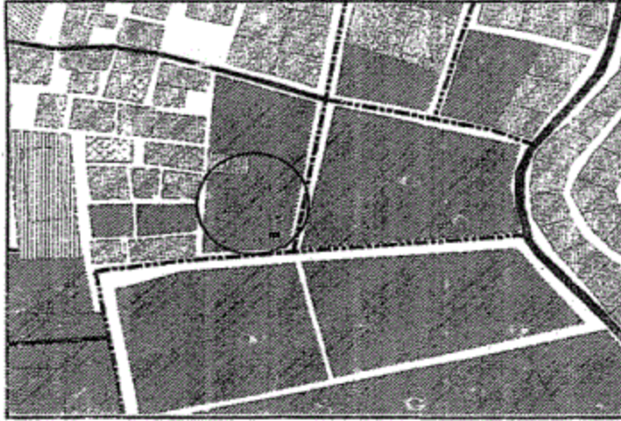
الموقع قبل التعديل