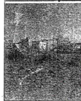
الموقع على الطبيعة