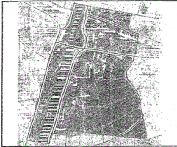
المخطط التفصيلي لمدينة الحامول لوحه رقم (8)