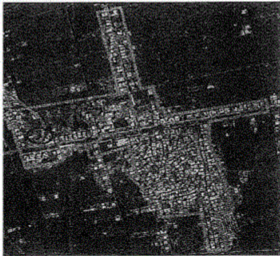
الصورة الفضائية لقرية المنشأة الصغرى